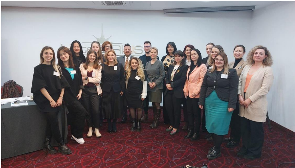
Сл. Работна група за економско јакнење на жените (Скопје и Приштина)