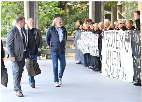
Сл. Белград, протест пред суд

Во рамки на програма спроведувана од страна на Жене у Црном, од Белград, Србија, претседателката зема учество на тродневна конференција на тема Популизам во земјите во Западен Балкан, одржана во септември 2024 во Белград. Од страна на претседателката на организацијата беше презентирано за состојбата со десничарскиот и левичарскиот популизам во Северна Македонија. Исто така во Белград како организација земавме учество на протест во знак на поддршка на актерка која беше жртва на сексуално вознемирување како и на судскиот процес.